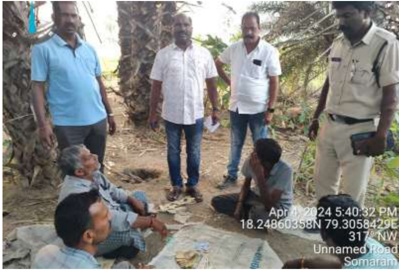
April 4, 2024 5:40:32 PM 18.24860358N 79.3058429E 317° NW Unnamed Road Somaram