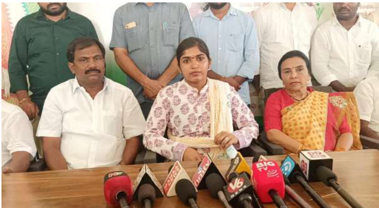
పరామర్శించాలని ఎద్దేవా చేశారు. ఘంటా కొత్త ప్రభుత్వం ఏర్పడి నాలుగు నెలలు కావొస్తున్నా ఇప్పటికీ అసెంబ్లీలో అడుగు పెట్టని కేసీఆర్.. పాలకుల పేరుతో పర్యటించడం విద్వేషంగా ఉందని అన్నారు. టీఆర్ఎస్ నాయకులు ఎన్ని కుట్రలు పన్నినా కాంగ్రెస్ పార్టీ కేసీఆర్ నీటి రాజకీయాలు చేస్తున్నారని మండిపడ్డారు. రా