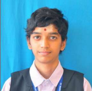
పోటీని నెగ్గకొని సీటు సాధించి తమ సత్కా చాటడం అభినందనీయుమని ప్రిన్సిపాల్ అభినందించారు.