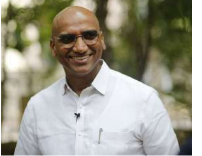
అవేదన వ్యక్తం చేశారు. బీజేపీ, కాంగ్రెస్ ఎన్ని కుట్రలు చేసినా తన సోదాటం ఆపవని స్పష్టం చేశారు. పార్లమెంటు ఎన్నికల్లో ఓట్లు అనే అయ్యంధంతో బీజేపీ, కాంగ్రెస్ కు బుద్ధి చెప్పాలని ప్రజలకు సూచించారు.