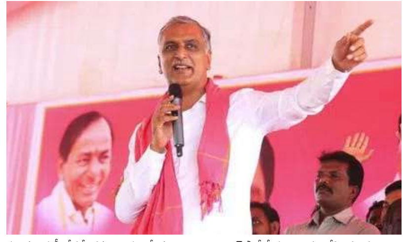
పట్టుకుని మళ్లీ రోడ్ల మీదకు తెచ్చింది.. మీకు 2500 ఇవ్వకుండా మోసం చేసినం.. అని మహిళా సదస్సు పెళ్లారా? అని ప్రశ్నించారు. ఈ రాష్ట్ర మహిళలకు

పూర్వయ్యింది.. అంటే మూడు నెలలు నిండి నాలుగు నెలలు సదున్నాయి. అంటే మూడు నెలలకు లెక్కే సుకున్నా.. ఈ రాష్ట్రంలో ప్రతి మహిళకు కాంగ్రెస్ ప్రభుత్వం రూ.7500 బకాయి పడింది' అని హరీ శ్రీరావు అన్నారు. బకాయి పడ్డ 7500 రూపాయలను మా అక్కాచెల్లెళ్లకు చెల్లించిన తర్వాతనే పార్లమెంటు ఎన్నికల్లో కాంగ్రెస్ పార్టీ ఓట్లు అడగాలని మండిపడ్డారు. ఏ మొహం పెట్టుకుని ఓటు అడుగుతారని ప్రశ్నించారు. ఈ రాష్ట్రంలో 90 లక్షల మంది తెల్ల రేషన్ కార్డుదారులు ఉన్నారు. కనీసం వారికి ఇచ్చినా కూడా దాదాపు ఈ మూడు నెలల్లో 7500 కోట్లు మహిళలకు చేరవేసిన అన్నారు. అంటే ఈ రాష్ట్రంలో అక్కాచెల్లెళ్లకు రూ. 7500 కోట్లు ఇవ్వకుండా కాంగ్రెస్ ప్రభుత్వం మోసం చేసిందని తెలిపారు.