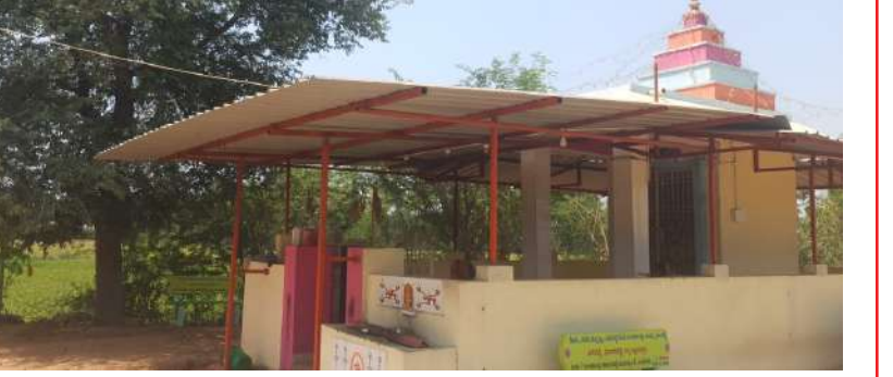
ఈనెల 25న తిరువతమ్మ కళ్యాణ మహోత్సవం