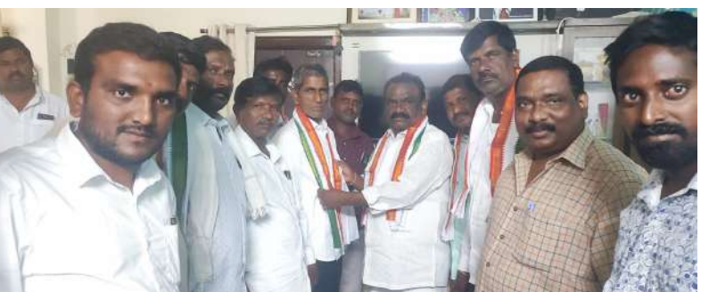
వివిధ పార్టీల నేతలు కాంగ్రెస్ లో చేరిక