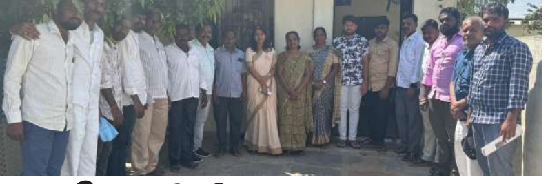
బిఎస్పీ తోనే నా ప్రయాణం