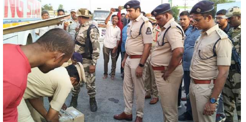
అంతర్జాతీయ బార్డర్ చెక్ పోస్ట్ ల పరిశీలన