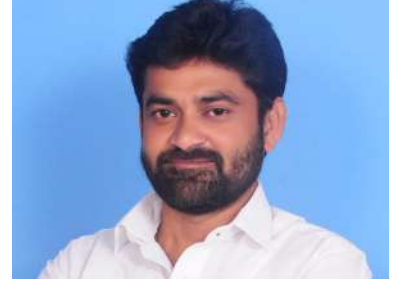
నే ఉద్దేశంతో బిజెపి మాడీ ఈడిఎన్ అర్థం పెట్టుకొని కేజ్రీవల్ ను అరెస్టు చేశారని తెలిపారు. వెంటనే అరెస్టు చేసేవారిని ను విడుదల చేయాలని ఆయన డిమాండ్ చేశారు. లోనే తగిన మూల్యం చెల్లించుకోవడం అరెస్టు చేసేవారిని ను విడుదల చేయాలని ఆయన డిమాండ్ చేశారు.

సూరారపు పరీక్షణ రాజ్ సూరారపు, విశాలభారతి: ఆమ్ ఆర్పీ పార్టీ జాతీయ కన్వీనర్, ఢిల్లీ ముఖ్యమంత్రి కేజ్రీవల్ ను అరెస్టు చేయడం అంటే ప్రజాస్వామ్యాన్ని ఖాసీ చేయడమేనని ఆమ్ ఆర్పీ పార్టీ తెలంగాణ అధికార ప్రతినిధి సూరారపు పరీక్షణ రాజ్ ఒక ప్రకటనలో తెలిపారు. అత్యంత ప్రజాదరణ పొందిన కేజ్రీవల్ ఢిల్లీలో అత్యంత నాణ్యమైన ఉచిత విద్య, వైద్యం అందిస్తున్న నాయకుడని, అలాంటి వ్యక్తిని అరెస్టు చేస్తే అది ప్రజాస్వామ్యాన్ని ఖాసీ చేయడమేనని స్పష్టం చేశారు. ఈ అరెస్టులను ఆమ్ ఆర్పీ పార్టీ విస్తృతంగా ప్రతిఘటించి, ప్రజాస్వామ్యాన్ని కాపాడాలని పిలుస్తూ ప్రకటించారు.