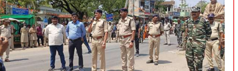
ప్రశాంతంగా ఎన్నికలకు ప్రజల సహకరించాలి