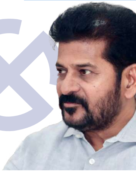
లోక్ సభ ఎన్నికలకు అధికార కాంగ్రెస్ రెడీ అయ్యింది. 14 సీట్లు గెలవడమే లక్ష్యంగా పావులు కదుపుతున్న 'హస్తం' పార్టీ గెలవడానికి కావాల్సిన అన్ని జాగ్రత్తలు తీసుకుంటోంది. పక్కా స్టాటజిస్ట్ అనిబి ఎన్నికల టార్గెట్ రీచీ అయిన తెలంగాణ కాంగ్రెస్ పార్లమెంట్ ఎన్నికలోనూ అదే పునాది అంటున్న చంద్రబాబునాయుడు. పార్లమెంట్ ఎన్నికల ప్రచారాన్ని కాంగ్రెస్ మొదలు పెట్టడం చెప్పింది. ఫిబ్రవరి 2న జరిగిన ఇంద్రవైల్లె బహిరంగ సభలో రేవంత్ రెడ్డి పార్లమెంట్ ఎన్నికల శంఖారావం మోగించారు. ఇక ఆ తర్వాత జరిగిన కోట్ల సభలో పార్లమెంట్ ఎన్నికల టార్గెట్ను రేవంత్ రెడ్డి ప్రకటించారు.