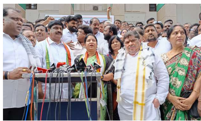
కాంగ్రెస్ పార్టీ ప్రజలందరినీ సంక్షేమ అభివృద్ధి వైపు నడిపించేందుకు కట్టుబడి ఉందన్నారు. రాష్ట్రంలో కాంగ్రెస్ ప్రభుత్వం ప్రజల ఆకాంక్షల ఆధారంగా ఏర్పడింది తెలిపారు.