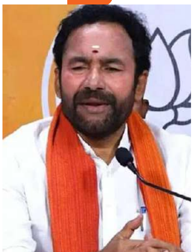
అధికారంలో వచ్చిన కాంగ్రెస్ ప్రజలను మోసం చేసిందని.. ఇప్పుడు కర్ణాటక బీజేపీ వైపు ఉంది 25 ఎంపీ సీట్లను బీజేపీ గెలువబోతుందని అన్నారు.

ఆరోపించారు. అంతేకాకుండా కాంగ్రెస్ పై విరుగు కుప్పడారు. అవినీతికి పెట్టింది పేరు కాంగ్రెస్.. ఆ పార్టీ నేతలు అవినీతి పరులని దుయ్యబట్టారు.