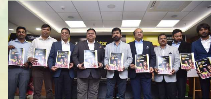
ఇన్వెస్టర్లపై ఆందోళన అక్కర్లేదు... హైదరాబాద్ కేంద్రంగా ఇన్వెస్టర్ల విషయంలో ఆందోళన చెందాల్సిన అవసరం లేదు. ఎందుకంటే ఏటా పెరుగుతున్న క్రయవిక్రయాలు హైదరాబాద్ గ్రోత్ కు రియల్ సూచికగా నిలుస్తున్నది. ఈ క్రమంలో పెరుగుతున్న ఇన్వెస్టర్ల భవిష్యత్తులో వచ్చే డిమాండ్ ను సమతుల్యం చేస్తుంది. దీని ద్వారా మార్కెట్ కొంతకాలంపాటు సుస్థిరంగా కొనసాగేందుకు అవకాశం ఉంది. ప్రస్తుతం తీరుగానే పెట్టుబడులు పెరిగి, కంపెనీలు అందుబాటులోకి వచ్చాయంటే క్రమంగా రెసిడెన్షియల్ ప్రాజెక్టులకు డిమాండ్ ఏర్పడుతుంది. నగరం, నగర జనాభా, ఉద్యోగ అవకాశాలు విస్తరిస్తున్నట్లుగానే హైదరాబాద్ కేంద్రంగా కొత్త ప్రాజెక్టులు అందుబాటులోకి వస్తున్నాయి.

కొత్త ప్రభుత్వం చేపట్టి అభివృద్ధి ప్రణాళికలను అమలు చేయడంలోనూ, అవసరమైన సహాయ సహకారాలు అందించేందుకు సిద్ధంగానే ఉన్నాం. ముఖ్యంగా విజన్ - 2050తో ఉన్న సీఎం చేపట్టే రెడ్డి రాష్ట్ర అభివృద్ధి ప్రణాళికలకు అవసరమైన సహాయ తోపాటు, నిపుణుల సలహాలు, ఇంజనీర్ నిపుణులతో హైదరాబాద్ మాస్టర్ ప్లాన్ రూపకల్పనలోనూ తమ పంతుగా ప్రభుత్వంతో కలిసి పనిచేయనున్నాం. ప్రస్తుతం రియల్ ఎస్టేట్ రంగంలో మానవ వనరుల కొరత కనిపిస్తోంది. భవిష్యత్ అవసరాలను పరిగణనలోకి తీసుకుంటే కనీసం 15 లక్షల న్యూల్డ్ లాబర్ కు డిమాండ్ ఉంది. ఈ క్రమంలో రాష్ట్రంలో ఉపాధి అవకాశాలను పెంచడంతోపాటు, స్టానిక అవసరాలకు అనుగుణంగా స్టానికలలో వృత్తి నైపుణ్యాలను పెంచేందుకు కోసం ప్రభుత్వంతో కలిసి పనిచేయనున్నాం. ఇక సుస్థిర పర్యావరణ అనుకూల విధానాలను అమలు చేయడం కోసం క్రెడాయ్ అడుగులు వేస్తోంది. దీని కోసమే ఐజీఐఐఐ, క్రెడాయ్ ఇండియా మధ్య కీలక ఒప్పందం కూడా కుదిరింది. ఈ ఒప్పందం ప్రకారం రానున్న కాలంలో 4వేల గ్రీన్ కవర్ ప్రాజెక్టులను దేశవ్యాప్తంగా నమోదు చేసేందుకు కృషి చేయనున్నాం. ఇందులో హైదరాబాద్ వాటాను అత్యధికంగా ఉండనుంది. గ్రీన్ ఇనిషియేటివ్, కూల్ రూఫ్, ఈ మొదలినీ, సన్ రూఫ్ పాలసీని రియల్ ఎస్టేట్ రంగంలో సమర్థవంతంగా అమలు చేయడానికి కావాల్సిన బృహత్ కార్యాచరణలతో సిద్ధంగా ఉన్నాం.