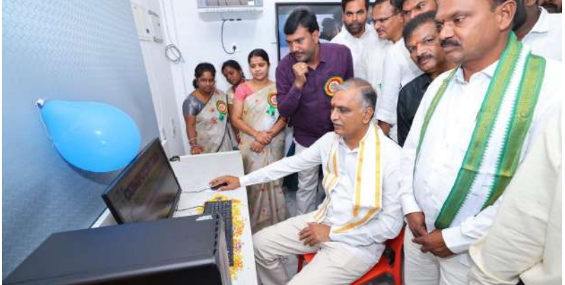
గతంలో వర్షం వస్తే పెచ్చులు ఉడుతాయని భయంతో ఈ బడిని బండ చేసేవారు. కానీ, నేడు కార్టోలేట్

పూటర్ పరిజ్ఞానం జీవన విధానంలో భాగమైందని చెప్పారు. జిల్లాలో ఎక్కువ మంది ఆడపిల్లలు చదివే పాఠశాల ఇది. ఈసారి పద్దో తరగతిలో వందశాతం ఫలితాలు సాధించాలన్నారు. మీరు నాకు ఇచ్చే లిటర్ గిఫ్ట్ అదే పది మార్లు సాధించడమేనని చెప్పారు. అలాగే సీటిని వ్యర్థం చేయవద్దు, అవసరం మేరకే నాడు కోవాలని సూచించారు. రాష్ట్రంలోని ప్రాథమిక ఆరోగ్య కేంద్రాల్లో బెషిషాద్ కారిత బాధాకరమని బీఆర్ఎస్ ఎమ్మెల్యే, మాజీ ఆరోగ్య మంత్రి హరీశ్ రావు అన్నారు. బెషిషాద్ కారిత ప్రజల ఆరోగ్యంపై ప్రభావం చూపుతుందని ఆయన చెప్పారు. బెషిషాద్ కారిత ప్రభుత్వం తక్షణమే చర్యలు తీసుకోవాలని హరీశ్ రావు డిమాండ్ చేశారు. సుమీక్ష జరిపి వీహెచ్ సిలో మందులు అందుబాటులో ఉండేలా చూడాలన్నారు.