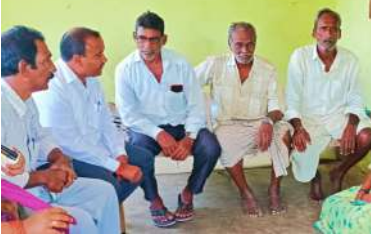
జడ్జిత్ విచారణ జరిపించాలని డిమాండ్ చేశారు. గురుకుల పాఠశాల విద్యార్థుల మరణాలపై సమగ్ర విచారణ జరిపి, వారి కుటుంబాలను ఆదుకోవాలని కోరారు.

సిపిఎం జిల్లా కార్యదర్శి వర్గ సభ్యులు మట్టిపల్లి సైదులు: మోతె, విశాలభారతి: సంక్షేమ బాలికల గురుకులు హాస్టల్ విద్యార్థి ఇరుగు అసౌకృత మట్టిపల్లి సైదులు జడ్జిత్ విచారణ జరిపించాలని సిపిఎం జిల్లా కార్యదర్శి వర్గ సభ్యులు మట్టిపల్లి సైదులు ప్రభుత్వాన్ని డిమాండ్ చేశారు.