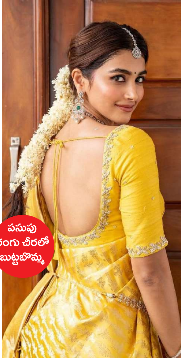
పసుపు రంగు చీరలో బుట్టబొమ్మ

టాలీవుడ్ సిని ప్రయులు మాస్ కా దాస్ అని ముద్దుగా పిలుచుకునే యంగ్ హీరో విశ్వక్ సేన్ వరుస సినిమాలతో దూసుకెళ్తున్నారు. గతేడాది దాస్ కా ధమ్మి హీరో తో కొట్టిన విశ్వక్.. ఈ ఏడాది రెండు మూడు చిత్రాలతో అలరించనున్నారు. నాలుగోగా మూటింగ్ జరుపుకుంటున్న గామి మూవీని ఇటీవల రేసులోకి తీసుకొచ్చారు విశ్వక్. శివరాత్రి కానుకగా ప్రేక్షకుల ముందుకు తీసుకురానున్నారు. అయితే ఇప్పటి వరకు మూస్ రోల్స్ ఎక్కువగా చేసిన విశ్వక్ సేన్.. గామి మూవీలో వైవిధ్యమైన పాత్రలో అలరించనున్నారు. మానవ స్వరూప తటకారేని ఓ అహోరగా కనిపించనున్నారు. ఇప్పటికే ఈ మూవీ నుంచి వచ్చిన ప్రమోషన్ ల కంటెంట్ సినిమాపై ఆసక్తి పెంచింది. ఈ సినిమా మేకర్స్ ఇటీవల రిలీజ్ చేసిన టీజర్.. సినిమాపై మరింత హైప్ క్రియేట్ చేసింది. యూట్యూబ్ లో నెం.1 ట్రెండింగ్ లో ఉంది. తాజాగా ఈ సినిమా టీజర్ పై పాన్ ఇండియా స్టార్ ప్రభాస్ ఇన్ స్టాగ్రామ్ వేదికగా ప్రశంసలు కురిపించారు. మూవీ టీమ్ కు బిగ్ బాస్టింగ్ ఇచ్చారు. టీజర్ ఎక్స్ ట్రాక్టర్ లిగా ఉందని ప్రభాస్ తెలిపారు. ఫిబ్రవరి 29వ తేదీన రిలీజ్ కానున్న ట్రైలర్ కోసం వేచి చూస్తున్నట్లు చెప్పారు. ప్రభాస్ ఇన్ స్టాగ్రామ్ లో షేర్ చేశారు విశ్వక్ సేన్. అయితే ప్రభాస్ ఎంత బిటిగా ఉన్నా.. కంటెంట్ ఉన్న సినిమాలను ఎంకరేజ్ చేయడంలో ముందు ఉంటారని ఫ్యాన్స్ కామెంట్లు పెడుతున్నారు.