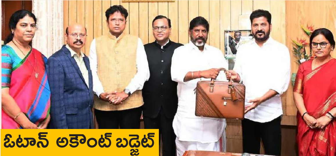
ఓటాన్ అకౌంట్ బడ్జెట్

ఆర్థిక వ్యవస్థను చు చేర్చారు. రాష్ట్రంలో మౌలిక సదుపాయాల కల్పనకు ప్రాధాన్యతనివ్వకుండా ప్రజలకు ఏ మాత్రం అవసరం లేని ఆర్కాటాలకు డబ్బు ఖర్చు చేశారు. రాష్ట్రం ఆర్థికంగా ఎంత దురదృష్టకర పరిస్థితిలో ఉందంటే ప్రతి నెల 1 వ తేదీన రాష్ట్ర ప్రభుత్వం ఉద్యోగులకు, పెన్షనర్లకు జీతాలు ఇవ్వలేనటువంటి పరిస్థితి దీని వల్ల ఉద్యోగుల క్రెడిట్ సౌకర్యం దెబ్బతింది. దీని వల్ల వారు రుణాలు పందలెక్కువ పోతున్నారు. అందుకే తెలంగాణ రాష్ట్ర ఆర్థిక పరిస్థితిని ప్రజల జీవితాలను దుర్భరం చేసే దిశగా సాగిన ప్రజా వ్యతిరేక పాలనకు ప్రజలకు చరమ గీతం పాడారు. ఇదే ప్రజాస్వామ్య వ్యవస్థ గొప్పతనం. దివాలా తీసిన రాష్ట్ర ఆర్థిక పరిస్థితిని మెరుగుపరచడానికి ఇప్పటికే దువారా ఖర్చులు తగ్గించారు. ఆర్థిక క్రమశిక్షణతో పాటు మెరుగైన సంక్షేమ పాలన ..మిగతా 2 లో