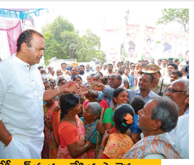
కేసీఆర్ షురూ చేసిన ప్రాజెక్టులు..