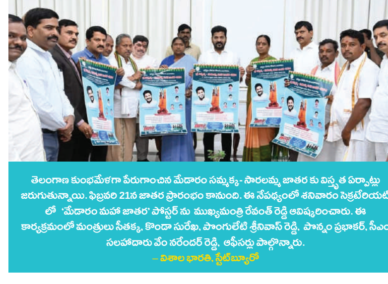
తెలంగాణ కుంభమేళగా పేరుగాంచిన మేదారం సముక్త్య సారలమ్మ జాతరకు విస్తృత విరాట్లు జరుగుతున్నాయి.