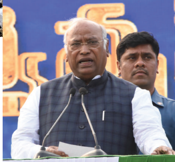
విశాల భారతి, నైట్ బ్యూరో:

బూత్ లెవల్ నుంచి రాష్ట్ర స్థాయి వరకు కాంగ్రెస్ పార్టీ తీవ్రం. కార్యకర్తలు అందరూ కలిసి పనిచేస్తేనే లోకసభ ఎన్నికల్లో మంచి ఫలితాలు సాధిస్తామని ఏబీసీ అధ్యక్షుడు మల్లికార్జున ఖర్చే అన్నారు. గురువారం హైదరాబాద్ ఎల్సీ స్టేడియంలో ఏర్పాటు చేసిన బూత్ స్థాయి కన్వీనర్ల సదస్సుకు ఆయన హాజరై ప్రసంగించారు. రెండు నెలల్లో లోకసభ ఎన్నికలు జరగనుండడంతో విజయం కోసం అంతా కలిసి పనిచేయాలని కోరారు. తెలంగాణలో పార్టీ క్యాంపు, రాజుల గాంధీ, దిశానిర్దేశం వల్ల అధికారంలోకి వచ్చామని, ఇక్కడ బీఎల్ఎల కష్టపడి ఎలాంటి ఫలితాలు తెచ్చారో.. దేశంలో కూడా అలాంటి ఫలితాలు పునరావృతం చేసేందుకు కృషి చేయాలన్నారు. కాంగ్రెస్ పార్టీకి బూత్ స్థాయి కార్యకర్తలే బలమని, కష్టపడి పనిచేయాలని పిలుపునిచ్చారు. ఈడీ, సీబీఐ దాడులు జరిగే అవకాశముందని, ప్రజాస్వామ్యాన్ని కాపాడుకోవడానికి కృషి చేయాలన్నారు. "దేశంలో నిరుద్యోగం, ప్రవృత్తిలు పెరిగిపోయాయి. ప్రధాని మోడీ గతంలో ఎన్నో హామీలు ఇచ్చారు. నల్లదనం తీసుకొచ్చి ప్రతి ఒక్కరి బ్యాంకు ఖాతాలో రూ. 1.5 లక్షల వాప్సును చేస్తామని చెప్పారు. కానీ, ఆ హామీని మర్చిపోయారు. తెలంగాణలో ఆరు గ్యారంటీడ్ రెండింటిని అమలు చేశారు. త్వరలోనే మరో రెండు అమలు చేస్తాం. తెలంగాణ ప్రభుత్వ పనితీరు దేశానికి ఆదర్శం