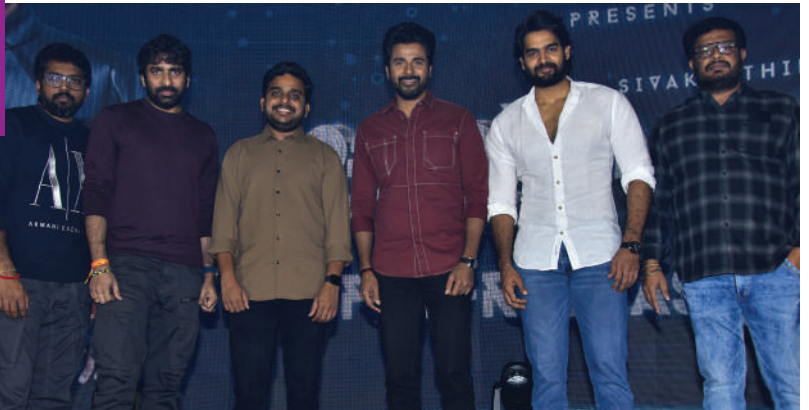
మనం ఎదుగుతూ మనలో పాటుపడిమందిని పైకి తీసుకు వెళ్లాలని అంటారు. శివ కార్తీయన్ గారు తన స్నేహితులను కూడా ఉన్నత స్థాయికి తీసుకు వస్తున్నారు. ఆయన రీసెంట్ మావీ 'మహావీరుడు' నా మ్యాస్ట్రో ఫేసరెట్.

'నా చిన్నప్పుడు కోయి మిల్ గయా' సినిమా చూసి హ్యాపీ రోషన్ ప్యాన్ అయ్యా. ఇప్పుడి 'అయలాన్' విడుదల తర్వాత తెలుగు రాష్ట్రాలలో చిన్నప్పటి అందరూ శివ కార్తీయన్ గారి అభిమానులు అయిపోతారు.