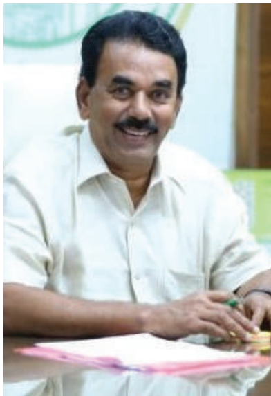
కోసం అన్నివర్గాలలో భారాన తరఫున పోటీ చేసేందుకు అభ్యర్థులు భయపడుతున్నారు. బీఆర్ఎస్ వేదికలను ఆధిపత్యం చేస్తూ మంత్రి నిర్ణయాలు విమర్శించారు.

నాడు రెండేండ్లు అయినా.. పనిగట్టు అన్నీ ట్లు.. నేడు రెండు నెలలు కూడా ఆగుతలేరేం.. మంత్రి జూబిల్డ్ కృష్ణారావు పై విశాల భారతి, స్టేట్ బ్యూరో: తెలంగాణకు పెట్టుబడులు తీసుకురావడంలో భాగంగానే పారిశ్రామికవేత్త అదానీ సీఎం రేవంత్ రెడ్డి కలిసి మంత్రి జూబిల్డ్ కృష్ణారావు తెలిపారు.