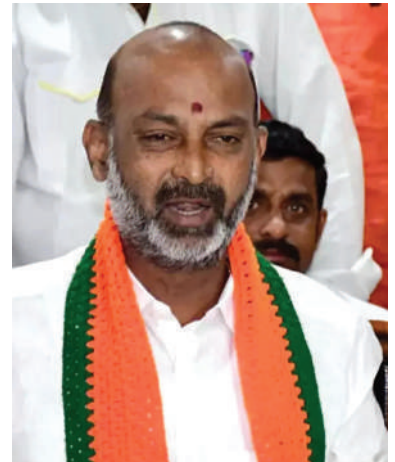
నిధి సేకరణలో తెలంగాణ అగ్రస్థానం అయోధ్యలో అందాల రామడు, అయోధ్య రాముడు, ఆదర్శ రాముడి విగ్రహ ప్రాణ ప్రతిష్ఠ కోసం యావత్ ప్రపంచమంతా ఎదురు చూస్తోందిన్నారు.

ఆరోగ్య కోసం యావత్ ప్రపంచమే ఎదురుచూస్తోంది అని ఆర్డీఎస్ రిపోర్ట్ బయ్యం అని ఎడ్డేవా చేస్తారా? జీవితీ జాతీయం రథాన కార్యదర్శి బండి సంజయ్ శాలభారతి హైదరాబాద్: అయోధ్య రామాలయంలో బాలరాముడి విగ్రహ ప్రతిష్ఠాపనకు ఏర్పాటు చేసిన సందర్భంగా సాగుతున్నాయి.