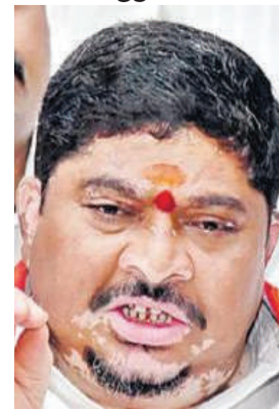
ప్రకారమే ముందుకు వెళ్తామని మంత్రి పొన్నం ప్రభాకర్ తెలిపారు. కొత్త అగ్రిమెంట్ వస్తే కొత్త ప్రతిపాదనలు ఉంటాయని వెల్లడించారు.

రవాణా శాఖ మంత్రి పొన్నం ప్రభాకర్ విశాల భారతి, స్టేట్ బ్యూరో: మహాత్మ్యి పథకం ద్వారా మహిళలకు ఉచిత బస్సు ప్రయాణం విజయవంతంగా కొనసాగుతుందని రవాణా & జీసీ సంక్షేమ శాఖ మంత్రి పొన్నం ప్రభాకర్ సంతోషం వ్యక్తం చేశారు.