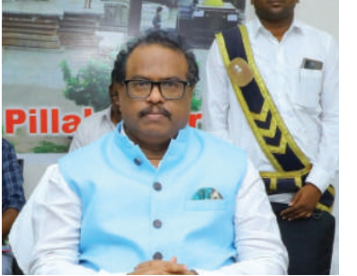
దం జరిగిందని తెలిపారు. అదేవిధంగా శాసన సభా నియోజక వర్గంలోని ఒక పోలింగ్ కేంద్రం నుండి మరొక కేంద్రం వచ్చి, ఇతర శాసన సభా నియోజక వర్గానికి పై అభ్యంతరాల దరఖాస్తులు స్వీకరిస్తారని కలెక్టర్ తెలిపారు.