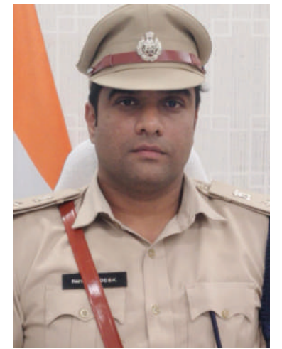
ప్రభుత్వ లక్ష్యం నెరవేరడానికి ప్రభుత్వ పంపిణీ వ్యవస్థ రేషన్ డీలర్లు, మిల్లర్లు బాధ్యతగా పని చేయాలని

సూర్యాపేట, విశాలభారతి: ప్రభుత్వం ఒక మంచి లక్ష్యం, ఉద్దేశ్యంతో పేద ప్రజల సంక్షేమం కోసం ప్రజా పంపిణీ వ్యవస్థ ద్వారా బివీఎస్ బియ్యంను అందిస్తుంది, అది లబ్ధిదారులకు చేరాలని, వీటి పంపిణీలో అక్షమాలకు పాల్పడ్డా, అక్షమ మార్గంలో అమ్మకాలు నిర్వహించినా, రిస్కీంగ్ చేసినా అలాంటి వారిపై చట్టపరమైన కఠిన చర్యలు తప్పవని పి.డి యాక్ట్ చట్టం సైతం నమోదు చేస్తామని సూర్యాపేట జిల్లా ఎస్సీ రావాలి హెగ్గే బివీఎస్ హెచ్.సి.ఎస్. అక్షమ రవాణాను క్షేత్ర స్థాయిలో అరికట్టడానికి సంబంధిత అధికారులతో సమన్వయంతో నిరంతరం కృషి చేస్తున్నామని, పి.డి ఎస్ బియ్యం అందించి మొల్లర్లు, అంతర్జాతీయ ట్రాన్స్ పోలిస్ నిఘా ఉన్నదని అన్నారు.