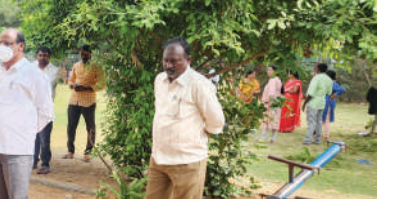
మాట్లాడుతూ జిల్లాలోని ఐదు మునిసిపాలిటీ లలో సిటిజన్ బుడ్డి ద్వారా పౌర సేవలు, ఫిర్యాదులు, అప్లైడ్ సర్వీసెస్, పన్నుల చెల్లింపులు, ప్రకటనలు, సలహాలు, సూచనలు తదితర అంశాలపై తెలుసుకోవచ్చని శా నిటీవల్, సిటి సరఫరా, వీడి లైట్ల సమస్యలు ఉంటే ఫిర్యాదులు అందించే వెంటనే పరిష్కరించ బడుతుంది అమె తెలిపారు. సిటిజన్ బుడ్డి ద్వారా సమస్యల పై ఫిర్యాదు చేయాలని అమె సూచించారు.