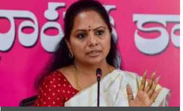
ఎమ్మెల్యే కవిత సోషల్ మీడియా అకౌంట్ హ్యాక్ ఇదిలా ఉండగా.. బీఆర్ఎస్ ఎమ్మెల్యే కల్యాణకుంట్ల కవిత సోషల్ మీడియా అకౌంట్ హ్యాక్ అయ్యాయి. ఇన్స్టాగ్రామ్, ఎక్స్ (ట్విట్టర్) హ్యాక్ కు గురయ్యారని కవిత తెలిపారు. సైబర్ నేరగాళ్లు మంగళవారం రాత్రి 10 గంటల నుంచి ఉదయం 11 గంటల వరకు పలుసార్లు హ్యాకింగ్ కు యత్నించారన్నారు. అనుమానాస్పదంగా లాగిన్ అయ్యి దుందగులు ఇన్స్టాగ్రామ్ అకౌంట్ నుంచి సంబంధంలోని వీడియోను హ్యాక్ చేశారని తెలిపారు. వెంటనే గుర్తించి సోషల్ మీడియా ఖాతాలను హ్యాకింగ్ కు గురైనట్లు ఎక్స్ (ట్విట్టర్) ద్వారా తెలిపారు. డీజిపి, సైబర్ సిక్యూరిటీ విభాగానికి ట్యాగ్ చేశారు. సోషల్ మీడియా ఖాతాలను పూర్తి స్థాయిలో తిరిగి పునరుద్ధరించే ప్రయత్నాలు జరుగుతున్నాయని తెలిపారు.