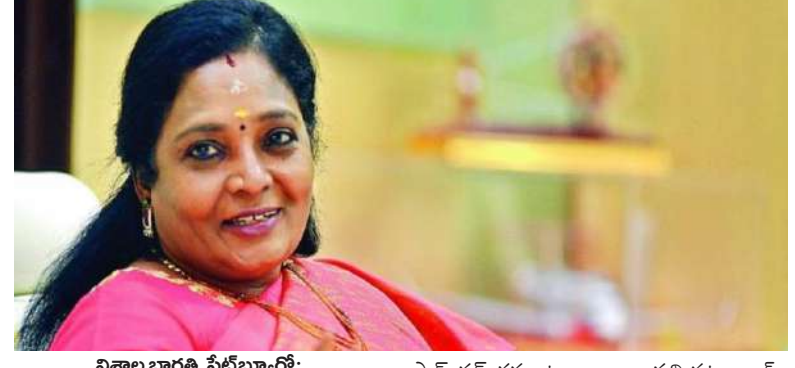
విశాల భారతి, స్టేట్ బ్యూరో: గత కొంతకాలంగా ఎందరో సెలబ్రిటీలు, రాజకీయ నేతలు హ్యాకింగ్ బారిన పడుతున్న విషయం తెలిసింది. తాజాగా రాష్ట్ర గవర్నర్ తమిళనాడు సాందర్ రాజన్ కూడా హ్యాకింగ్ బాధితు రాలయ్యారు. ఆమె ఎక్స్ (ట్విట్టర్) అకౌంట్ హ్యాక్ కు గురైంది. గుర్తు తెలియని వ్యక్తులు గవర్నర్ ఎక్స్ ఖాతాను హ్యాక్ చేసి పాస్ వర్డ్ మార్చినట్లు సమాచారం. కంపెనీ నియమనిబంధనలు ఉల్లంఘించారంటూ ఎక్స్ కంపెనీ నుంచి గవర్నర్ కు ఓ మెయిల్ వచ్చినట్లు తెలుస్తోంది. గవర్నర్ తన అకౌంట్ ను ఓపెన్ చేసేందుకు ప్రయత్నించగా, పాస్ వర్డ్ తప్పంటూ జవాబు వచ్చినట్లు రాజ్ భవన్ అధికారులు తెలిపారు. అందులో పోస్టులను పరిశీలించిన తమిళనాడు సమన్వయ కమిటీ సభ్యులు విషయం తెలిపారు. తనకు సంబంధించిన విషయంపై రాజ్ భవన్ సిబ్బందిని ఆరా తీసినట్లు చెప్పారు. వివరకు తన అకౌంట్ హ్యాకింగ్ కు గురై ఆ డేకాలలో రాజ్ భవన్ అధికారులు సైబర్ పోలీసులను ఆశ్రయించారు. గవర్నర్ ఎక్స్ అకౌంట్ ను గుర్తుతెలియని వ్యక్తులు హ్యాక్ చేశారంటూ ఫిర్యాదు చేశారు.