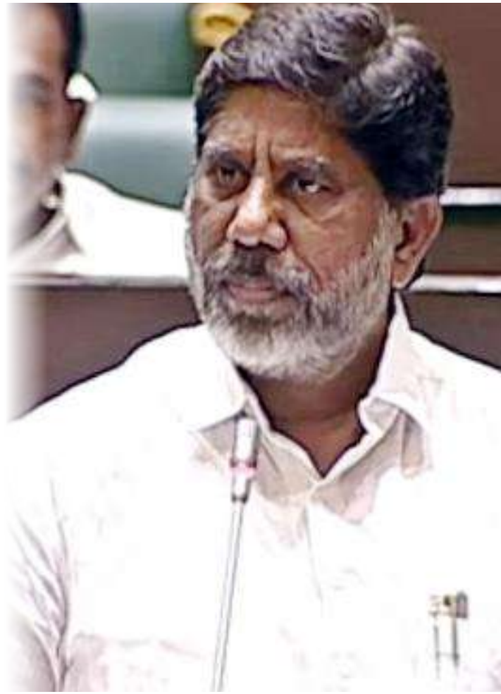
విశాల భారతి, స్టేట్ బ్యూరో

తెలంగాణ అసెంబ్లీలో విద్యుత్ పై వాడీ వేధీ చర్చ సాగింది. అసెంబ్లీ సమావేశాల్లో భాగంగా గురువారం రాష్ట్రంలో ప్రస్తుత పవర్ పరిస్థితులపై కాంగ్రెస్ ప్రభుత్వం శ్రేణిపత్రం విడుదల చేసింది. డిప్యూటీ సీఎం మల్లు భట్టి విక్రమార్క రాష్ట్రంలో కరెంటు శాఖ సంక్షోభంపై గత ప్రభుత్వాలు చేసిన తప్పిదాలను వివరించారు. దీంతో ప్రభుత్వ సంస్థలు, ఆఫీసుల్లో రూ. 28, 842 కోట్ల బకాయిలు ఉన్నాయని ఆయన తెలిపారు. డిస్కం ద్వారా రూ. 62, 461 కోట్ల నష్టాలు వచ్చాయని వెల్లడించారు. పదేండ్ల బీఆర్ఎస్ పాలనలో వారు సాధించింది శూన్యమని భట్టి విక్రమార్క మండిపడ్డారు. దీనిపై ప్రతిపక్షాలు భగ్గువచ్చాయి. విద్యుత్ రంగంపై వాస్తవాలు ప్రజలకు, శాసనసభ్యులకు తెలియాలన్న ఉద్దేశంతోనే శ్రేణిపత్రం ప్రవేశపెట్టినట్లు ఉప ముఖ్యమంత్రి, విద్యుత్ శాఖ మంత్రి భట్టి విక్రమార్క తెలిపారు. రాష్ట్ర అభివృద్ధి, ఆర్థిక వ్యర్థాల్లో విద్యుత్ రంగం కీలక పాత్ర పోషిస్తుందని అన్నారు. పరిశ్రమలు, వ్యవసాయం, రవాణా, వైద్య, సమాచార, సేవారంగం అభివృద్ధికి సమృద్ధిగా ఉన్నా, నాణ్యమైన విద్యుత్ వెన్నెముకని భట్టి విక్రమార్క పేర్కొన్నారు. రాష్ట్ర మనుగడకు విద్యుత్ రంగ పరిష్కారం చాలా అవసరమన్న ఆయన, ప్రజల నాణ్యమైన జీవన శైలికి సూచిక విద్యుత్ నున్నారు. రాష్ట్రాభివృద్ధి నాటికి ఉన్న ప్రాజెక్టులు, ఆ తర్వాత ప్రారంభించినవి తదితర వివరాలన్నీ శ్రేణిపత్రంలో స్పష్టంగా వివరించామన్నారు. అవసరమైన కొత్త ప్రాజెక్టులు తీసుకురాకపోగా, ఉన్న వాటిని కుదేలయ్యేలా చేసిన అప్పులు అందో శసకరంగా ఉన్నాయన్నారు. తెలంగాణ ఏర్పడిన 2014 నాటికి డిస్కం రూ.10 వేల 783 కోట్ల రుణంలో ఉండగా, ఈ ఏడాది అక్టోబరు నాటికి