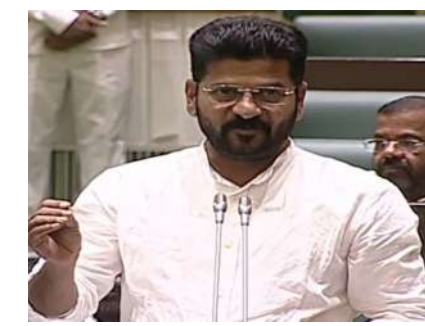
విశాలభారతి, స్టేట్ బ్యూరో:

తెలంగాణ అసెంబ్లీ సమావేశాలు వాడీవేడిగా కొనసాగు తున్నాయి. శ్వేతపత్రంపై అసెంబ్లీలో అధికార కాంగ్రెస్, ప్రతిపక్ష బీఆర్ఎస్ మధ్య మాటల తూటాలు పేలాయి. సభ సమావేశాలు ప్రారంభం కాగానే.. రాష్ట్ర ఆర్థిక పరిస్థితిపై సభలో స్వల్పకాలిక చర్చ ప్రారంభమైంది. డిప్యూటీ సీఎం భట్టి విక్రమార్క రాష్ట్ర ఆర్థిక స్థితిపై శ్వేత పత్రాన్ని విడుదల చేసి ప్రసంగించారు. 42 పేజీల శ్వేత పత్రాన్ని సభ్యులకు అందించారు. 'ప్రజలంతా అభివృద్ధి చెందాలని తెలంగాణ సాధించుకున్నాం.. గత ప్రభుత్వం