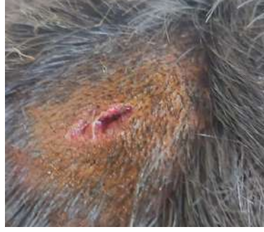
తీసివేసి సు వెంటనే విధుల నుండి తొలగించి శాఖ వరమైన చర్యలు తీసుకోవాలని డిమాండ్ చేశారు. లేనియెడల విద్యార్థి సంఘాలు, రాజకీయ పార్టీల రకు నబలు అని ప్రశ్నించారు.

పాత, విశాల భారతి: విద్యార్థులకు పాఠాలు నేర్పాటైన ఉపాధ్యాయుడు సొంత పనులకు విద్యార్థులను ఉపయోగించుకోవడంతో విద్యార్థి గాయాలపాలైన సంఘటనపై మండల రాష్ట్రపాఠశాల గ్రామంలో వాటిని తీసుకుంది.