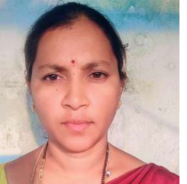
ఉన్నాయని ఆమె తెలిపారు ఆయన పదవి కోసం కాకుండా ప్రజల కోసం ప్రగతి కోసం పదే తనన కొనియాడ తగ్గదని ఆమె అన్నారు.