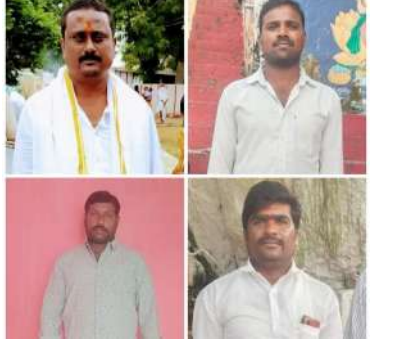
ఎన్నికైన చైర్మన్లను గ్రామ ప్రజలు సన్మానించారు. ఈ కార్యక్రమంలో కాంగ్రెస్ పార్టీ నాయకులు, కార్యకర్తలు తదితరులు పాల్గొన్నారు.

మునుగాల, విశాల భారతి: మండల పరిధిలోని రేపాల గ్రామంలో సోమవారం కాంగ్రెస్ పార్టీ గ్రామ శాఖ ఆధ్వర్యంలో రేపాల గ్రామంలోని లక్ష్మీ నరసింహ స్వామి, వెంకటేశ్వర స్వామి, శివాలయాలం, అంజనేయ స్వామి దేవస్థానం చైర్మన్లను ఏకగ్రీవంగా ఎన్నుకున్నారు.