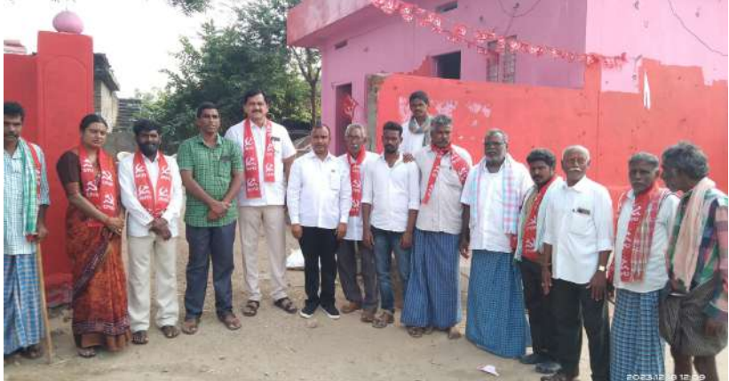
గత పాత కుటుంబ నిరంకుశంగా వ్యవహరించారని దీని మూలంగా ప్రజాగ్రహణకి గురైన ప్రజలు వారితో తాళక తీరును ఇచ్చారని అన్నారు. ప్రజల సహకారంతోనే నిర్మించిన పార్టీ కార్యాలయాన్ని అక్రమంగా ఆక్రమించిన విషయమై అనేకసార్లు గత అధికార పార్టీ నాయకులకు విన్నవించిన పట్టించుకోలేదన్నారు.