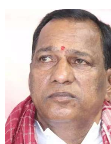
పోలీస్ స్టేషన్లో ఎస్సీ, ఎస్సీ అల్లాసితో 420 చీటింగ్ కేసు నమోదు చేసినట్లు పోలీసులు తెలిపారు.