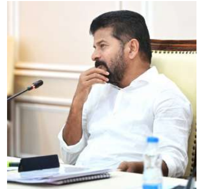
అసెంబ్లీకి కట్టుదిట్టమైన భద్రత ఏర్పాటు చేయాలని అధికారులకు ఆదేశాలు జారీ చేశారు.

పార్లమెంటు నమూనా తరహాలో తెలంగాణ అసెంబ్లీ ఉంటుందని సీఎం రేవంత్ రెడ్డి తెలిపారు. శాసనసభ, శాసన మండలి ఒకే దగ్గర నిర్వహించే ఉంటుందన్నారు.