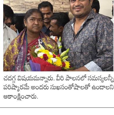
చదగ్గ విషయమన్నారు. వీరి పాలనలో సమస్యలన్నీ పరిష్కారమే అందరూ సుఖసంతోషాలతో ఉండాలని ఆకాంక్షించారు.