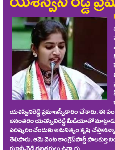
విశాల భారతి, స్టేట్ బ్యూరో: తెలంగాణ అసెంబ్లీ సమావేశాలు ప్రారంభమయ్యాయి. కొత్తగా ఎన్నికైన ఎమ్మెల్యేలతో ప్రాటించి స్వీకర్ అక్షరధర్మిన్ కిషన్ ప్రమాణం చేయించారు.

ప్రజాసేవకు లక్షకేసులను వెల్లడి విశాల భారతి, స్టేట్ బ్యూరో: తెలంగాణ అసెంబ్లీ సమావేశాలు ప్రారంభమయ్యాయి. కొత్తగా ఎన్నికైన ఎమ్మెల్యేలతో ప్రాటించి స్వీకర్ అక్షరధర్మిన్ కిషన్ ప్రమాణం చేయించారు.