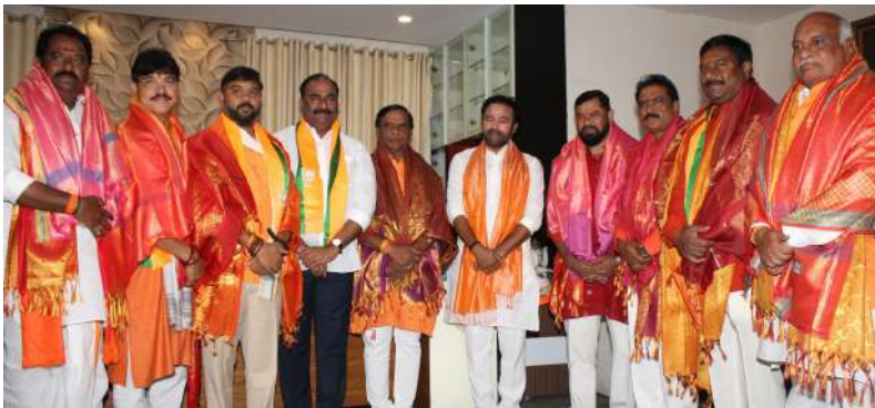
నోతో చేసుకున్న ఒప్పందం ప్రకారం ఆ పార్టీ వ్యక్తిని ప్రాటించి స్వీకర్ చేసింది. అక్కర్లేనట్టే ఓవైసీని ప్రాటించి ఎమ్మెల్యేలను కాదని ఏ ప్రాతిపదికన ప్రాటించి స్వీకర్ అక్కర్లేనట్టేనే చేశారని ప్రశ్నించారు.

లోపాయికాల ఒప్పందంతోనే మజ్జిన్ ప్రాటించి స్వీకర్ ప్రభుత్వానికి ఎంఐఎం బందో బిరుదు బీజేపీ రాష్ట్ర అధ్యక్షుడు జి. కిషన్ రెడ్డి విశాల భారతి, స్టేట్ బ్యూరో: