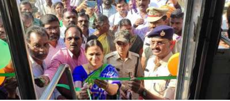
నియోగం చేసుకోవాలన్నారు. మిర్యాలగూడ ఆర్టీసీ డిపో నుంచి తొలి పల్లె వెలుగు బస్సు నల్లంపల్లి ప్రయాణం ప్రారంభించిన మహిళలు.