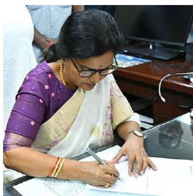
హైదరాబాద్, విశాల భారతి: తెలంగాణలో కాంగ్రెస్ ప్రభుత్వం ఏర్పడిన వెంటనే పలు మార్పులకు శ్రీకారం చుట్టారు.