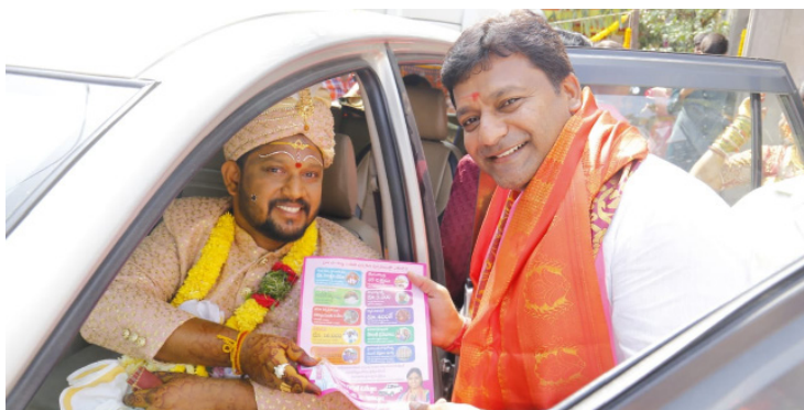
సికింద్రాబాద్ కంటోన్మెంట్, విశాలభారతి:

ఎన్నికలవేళ వింత అనుభవాలు ఎదురవుతున్నాయి. ఎన్నికల్లో పోటీ చేస్తున్న అభ్యర్థుల తరపున నాయకులు పెద్ద ఎత్తున ప్రచారం చేస్తున్నారు. ఈ ఘోటోను చూస్తే కంటోన్మెంట్ నియోజకవర్గంలో జరిగిన ప్రచారం ఎలా ఉందో కళ్ళకు కట్టినట్టు కనిపిస్తోంది. అప్పుడే పెళ్ళి పూర్తి చేసుకొని కారులో ఇంటికి బయలుదేరిన ఓ పెళ్ళి స్థానిక కంటోన్మెంట్ బోర్డు మాజీ ఉపాధ్యక్షులు జెఎంఆర్ పార్టీ కరపత్రికాన్ని ఆయనకు పంపిస్తూ పెళ్ళికొడుకు నీ ఓటు నాకు, పెళ్ళి విందు నీకు అంటూ ప్రచారం చేశారు. ఈ వింత కారే ఈ వింత ఘోటోను చూసిన స్థానికులు ఒకసారి నవ్వుల వుప్పులు వికసించాయి.. ఎన్నికల ప్రచారంలో ఏ ఒక్కరిని కూడా వదిలిపెట్టేటట్టు లేదు ఈ నాయకులు. బిందు అయినా చావు