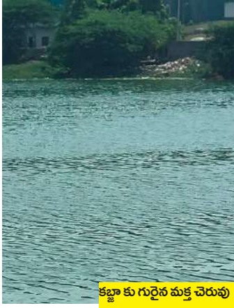
కట్టా కు గురైన మక్తా చెరువు