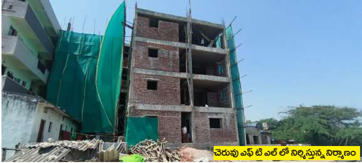
చెరువు ఎఫ్ టి ఎల్ నిర్మాణం నిర్మాణం