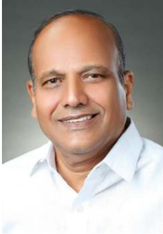
ఎంబీసీ 36 కులాల చెందిన వారికి నియమించాలని బుధవారం విడుదల చేసిన పత్రికా ప్రకటనలో కోరారు.