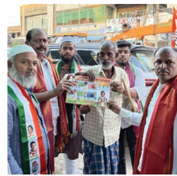
కాంగ్రెస్ పార్టీ నాయకులు, కార్యకర్తలు, తదితరులు పాల్గొన్నారు.

నియోజకవర్గంలో కాంగ్రెస్ పార్టీ ఆరు గ్యారెంటీ పథకాలను జరిపేటి జైపాల్ విస్తృతంగా ప్రచారాన్ని నిర్వహిస్తున్నారు. ఇంటింటికి కాంగ్రెస్ పార్టీ నాయకులు కార్యకర్తలతో తిరిగి ఇందిరమ్మ పాలనను గుర్తు చేస్తూ ప్రజలతో మమేకమవుతున్నారు. తెలంగాణలో కాంగ్రెస్ పార్టీని ఆదరించి అఖండ మెజార్టీతో గెలిపించాలని ఓటర్లను కలుస్తూ అభ్యర్థిస్తున్నారు. ఈ కార్యక్రమంలో