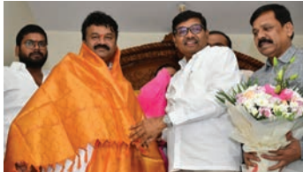
సంబరాలు జరుపుకున్నారు. ఈ కార్యక్రమంలో విజయ డైరీ ఉద్యోగులు సిబ్బంది కార్కులు పాల్గొన్నారు.