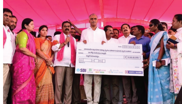
రూ. 600 మాత్రమే ఇస్తున్నారని అన్నారు. "అడవి జైలు చదువుకోవాలి.. పైకి రావాలని చెప్పి.. పెద్ద ఎత్తున పిల్లల కోసం డిగ్రీ కాలేజీలు, పీజీ కళాశాలలు ఎన్నో కార్యక్రమాలు తెచ్చారు. మహిళా యూనివర్సిటీ కూడా రాష్ట్రంలో సీఎం ప్రారంభించారు. మహిళల కోసం అనేక కార్యక్రమాలు చేశారు. ఏ పని చేసిన మహిళలకే లబ్ధి అందాలని చెప్పారు. మహిళలను ఇంకా ఎలా ఆర్థికంగా బలోపేతం చేయాలి. మహిళల కోసం మేనిఫెస్టోలో మహిళల కోసం శుభవార్తలు కచ్చితంగా ఎంటారు." అని హరీశ్ రావు అన్నారు. అధికారంలో ఉన్న కర్ణాటకలో రైతుబంధు, రూ. 4 వేల పింపన ఎందుకు ఇవ్వట్లేదని కాంగ్రెస్ నాయ

ప్రస్తుతం కృష్ణా నుంచి తాగునీరు వస్తోంది. త్వరలోనే తాగునీరు కూడా వస్తుంది. కాంగ్రెస్ నేతలు అరచితిలో వైకుంఠం చూపిస్తారు. ఓటుకు నోటు కేసులో రేవంకరెడ్డి జైలుకు వెళ్లటం ఖాయం. 3 వేల తండాలును సీఎం కేసీఆర్ గ్రామంచువారతిగా మార్చారు. ఇంటింటికి సర్దా ద్వారా మంచినీరు మహిళల కష్టాలు తీర్చారు కేసీఆర్. ఈసారి ఎన్నికల మేనిఫెస్టోలో మహిళలకు సంబంధించిన పథకాలు ప్రవేశపెట్టనున్నారని మంత్రి హరీశ్ రావు స్పష్టం చేశారు. కాంగ్రెస్ పాలనలో 'నేను రాను బిడ్డో.. సర్కార్ దవాఖానాకు' అని పాడుకునేవారని మంత్రి హరీశ్ రావు గుర్తు చేశారు. కానీ కేసీఆర్ హయాంలో సర్కార్ దురాఖానాలో నూతన స్పెషాలిటీ ఆస్పత్రులు మూరాయని తెలిపారు. బిడ్డ కడుపున పడినప్పటి నుంచే ప్రభుత్వ సాయం అందుకోవడం చెప్పారు. అదే విధంగా గర్భిణీలకు రూ. 12 వెలు ఇస్తున్నామని. కాస్త తర్వాత కేసీఆర్ కిట్లు ఇస్తున్నామని వివరించారు. ఇంకా 12 లక్షల మంది ఆడపిల్ల వివాహాలకు రూ.లక్ష చొప్పున ఆర్థికసాయం చేశామన్నారు. అదే పాడుగున ఉన్న కర్ణాటకలో ఎలాంటి పథకాలు ఉన్నాయో తెనుకోవాలని సూచించారు. ఆ రాష్ట్రంలో వ్యర్థాల పేదరూపం నెలకు కేవలం