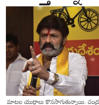
నేతలను అరెస్ట్ చేయడమే ప్రభుత్వం పనిగా పెట్టుకుందని ఆరోపించారు. చంద్రబాబు అరెస్ట్ పై సినీ ప్రజలకు స్పందించకపోవడంపై బాలయ్య మాట్లాడారు. ఎవరు స్పందించినా స్పందించకపోవే నేతలు చంద్రబాబు అరెస్ట్ పై స్పందించినా, ఎన్టీఆర్ జపం చేసినా ఎటువంటి లాభం లేదని బాలకృష్ణ అన్నారు. రెండు రాష్ట్రాల కనకం రెండు కళ్లు లాంటివని అన్నారు. తెలంగాణ తెలుగుదేశం పార్టీకి తాను అందగా ఉంటానని అన్నారు. చంద్రబాబు అక్రమ అరెస్ట్, ఏపీలో జరుగుతున్న పరిణామాలు, తాజా రాజకీయ అంశాలపై చర్చించారు. ప్రజా సంక్షేమాన్ని గాలికి వదిలేసి ప్రతిపక్ష పార్టీల