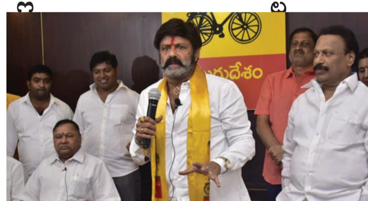
కల్లో ఓట్ల కోసం ఎన్టీఆర్ పేరును వాడుతున్నారని మండిపడ్డారు. చంద్రబాబు అరెస్ట్ పై కొందరు వెంటనే స్పందించ లేదని పరోక్షంగా బిఆర్ఎస్ పై బాలకృష్ణ విమర్శలు చేశారు. తెలంగాణ రాజకీయ నేతలు చంద్రబాబు అరెస్ట్ పై స్పందించినా, ఎన్టీఆర్ జపం చేసినా ఎటువంటి లాభం లేదని బాలకృష్ణ అన్నారు. రెండు రాష్ట్రాల కనకం రెండు కళ్లు లాంటివని అన్నారు. తెలంగాణ తెలుగుదేశం పార్టీకి తాను అందగా ఉంటానని అన్నారు. చంద్రబాబు అక్రమ అరెస్ట్, ఏపీలో జరుగుతున్న పరిణామాలు, తాజా రాజకీయ అంశాలపై చర్చించారు. ప్రజా సంక్షేమాన్ని గాలికి వదిలేసి ప్రతిపక్ష పార్టీల

అటు టీడీపీ, ఇటు వైసీపీ నేతల మధ్య ప్రతి రోజు విమర్శల వర్షం కొనసాగుతోంది. ఇక తాజాగా బాలకృష్ణ తెలంగాణ రాజకీయ నేతలపై ఘాటు వ్యాఖ్యలు చేశారు. ఓట్ల కోసం మూడు రోజులుగా ఎన్టీఆర్ జపం చేస్తున్నారని ఆరోపించారు. చంద్రబాబు అరెస్ట్ అయినప్పుడు మాట్లాడకుండా ఇప్పుడు ఎన్నికల్లో ఓట్ల కోసం ఎన్టీఆర్ పేరును వాడుతున్నారని మండిపడ్డారు. ఏపీ, తెలంగాణలో రాజకీయాల జేరేందుకు ఉంటున్నాయి. ఒకరిపై ఒకరు మాటలు యుద్ధాలు కొనసాగుతున్నాయి. ఏపీలో చంద్రబాబు అరెస్టు తర్వాత రాజకీయ పరిణామాలు ఇబ్బందిగా మారిపోయాయి. అటు టీడీపీ, ఇటు వైసీపీ నేతల మధ్య ప్రతి రోజు విమర్శల వర్షం కొనసాగుతోంది. ఇక తాజాగా బాలకృష్ణ తెలంగాణ రాజకీయ నేతలపై ఘాటు వ్యాఖ్యలు చేశారు. ఓట్ల కోసం మూడు రోజులుగా ఎన్టీఆర్ జపం చేస్తున్నారని ఆరోపించారు. చంద్రబాబు అరెస్ట్ అయినప్పుడు మాట్లాడకుండా ఇప్పుడు ఎన్ని