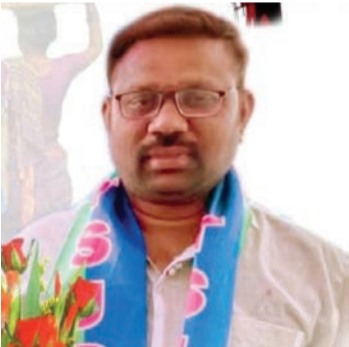
ఇందిరా పార్క్ వద్ద పూసల గోస నిరసన దీక్ష చేపడుతున్నామని రాష్ట్రంలో ఉన్న పూసల కులస్తులందరూ ఆధిక సంఖ్యలో పాల్గొని విజయవంతం చేయాలని కోరారు