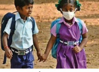
ఇచ్చారు. తిరిగి అక్టోబర్ 26న పాఠశాలల తిరిగి తెరుచుకోవాలి. తెలంగాణ ప్రజలు అక్టోబర్ 24వ తేదీన దసరా పండుగ జరుపుకోవాలి. అక్టోబర్ 22న దుర్గాష్టమి అదే రోజు బతుకమ్మ పండుగ నిర్వహిస్తారు. ఈ నేపథ్యంలో స్కూళ్లు, కాలేజీలు, కార్యాలయాలకు తెలంగాణ ప్రభుత్వం ముందుగానే సెలవులు ప్రకటించింది.

తెలంగాణలో అత్యంత వైభవంగా జరుపుకునే పండుగల్లో దసరా మొదటి వరుసలో ఉంటుంది. అందుకే సూర్యోత్సవం, కాలేజీలకు ముందుగానే సెలవులు ప్రకటించారు. ఈ సందర్భంగా బతుకమ్మ, దసరా పండుగలను పురస్కరించుకొని రాష్ట్రంలోని బడుగుల విద్యార్థులకు సెలవులు ప్రకటించింది. అక్టోబర్ 13వ తేదీ నుంచి అక్టోబర్ 25వ తేదీ వరకు 13 రోజుల పాటు ప్రభుత్వ, ప్రైవేట్ బడుగుల సెలవులు ఉంటాయని తెలిపింది. ఈ మేరకు రాష్ట్రంలోని అన్ని రకాల స్కూళ్లు ఈ సెలవులు పాటించాలని సూచించింది. అలాగే తెలంగాణలోని ఇంటర్మీడియట్ కాలేజీలకు మాత్రం 19 నుంచి 25 వరకు సెలవులు ఇవ్వబడింది. తెలంగాణలో దసరా సెలవులు గతేడాది 14 రోజులు ఉండగా.. ఈసారి మాత్రం 13 రోజులే