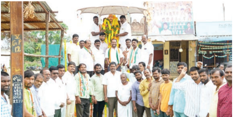
గొప్ప వ్యక్తిత్వంతో బ్రిటిష్ సామ్రాజ్యాన్ని పడగొట్టి, దేశానికి స్వాతంత్ర్యం తెచ్చడం గాంధీజీ జీవితం