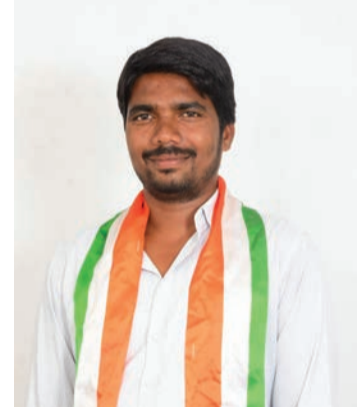
ఉద్యోగాలు అని గారడీ మాటలు చెప్పిన కేసీఆర్ కు రాజీయే ఎన్నికల్లో నిరుద్యోగుల చేతిలో ఓటమి తప్పదు అన్నారు.