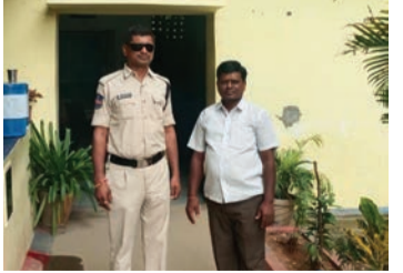
యకులను అక్రమ ఆరెస్టులను చేసి భయభ్రాంతులకు గురి చేస్తున్నారని అన్నారు. పోలీసు అరెస్టులతో లాఠీ చార్జీలతో ఉద్యమాలను ఆపలేరని అన్నారు.

చిట్టాల, విశాలభారతి: అంగన్వాడీ, ఆశా, మధ్యాహ్నం భోజన పథకం, రాష్ట్ర వ్యాప్త సమైక్య జరుగుతున్న సందర్భంగా జిల్లాలో మంత్రులు పర్యటన చేస్తున్న ప్రతిపాటి అర్చనా ప్రకాశ పోలీస్ లు అక్రమ ఆరెస్టులు చేయడం దురదృష్టవశాత్తూ సీపీఐయూ అన్నారు. సమస్యలు పరిష్కరించాలని ఆయన రంగాల కార్యకర్తలు మలమకొని ఆంగ్లేయులపై పోరాటం కొనసా