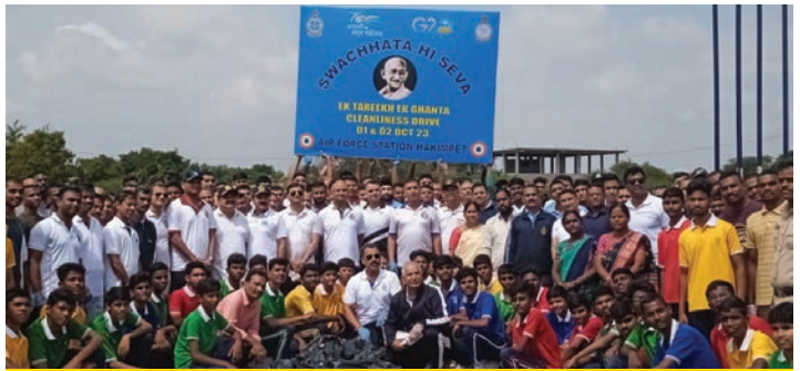
స్వచ్ఛత హి సేవ కార్యక్రమంలో భాగంగా హాకింపేట్ ఎయిర్ ఫోర్స్ స్టేషన్ ఆధ్వర్యంలో షామీర్ షేక్ పెద్ద చెరువులో శుభ్రత కార్యక్రమాన్ని చేపట్టారు. ఈ కార్యక్రమంలో ఎయిర్ ఫోర్స్ అధికారులు, సిబ్బంది, తదితరులు పాల్గొన్నారు.