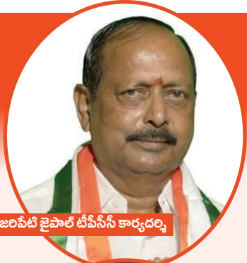
జరిపేటి జైపాల్ టీఎస్ఎస్ ఐ కార్యదర్శి