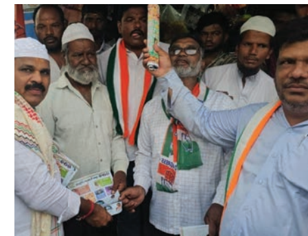
రు. విచిత్రమేమంటే బీఆర్ఎస్ నాయకులు కాంగ్రెస్ ఇచ్చిన హామీలు అమలుకు సాధ్యం కాదంటారు. వారిచ్చే హామీలు మాత్రం అమలుకు సాధ్యమని గొప్పలు చెబుతున్నారు.