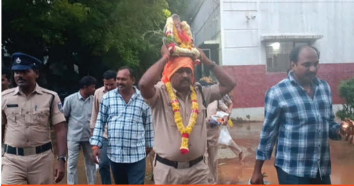
అల్వాల్ పోలీస్ స్టేషన్లో మట్టి వినాయకుని ప్రతిష్ఠించి 11 రోజులు పూజలు అందుకున్న వినాయకుడు గురువారం పోలీస్ స్టేషన్ సిబ్బంది డబ్బు మేకాపాతో నృత్యాలు చేస్తూ ఘనంగా ఊరేగిస్తూ నిమజ్జనం చేశారు