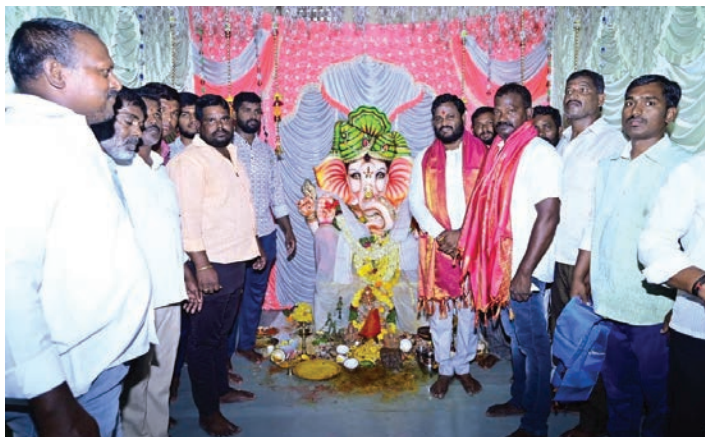
పటాన్ చెరు-విశాలభారతి :