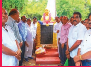
బహుజనుల గొంతుక డాక్టర్ బాబాసాహెబ్ అంబేద్కర్