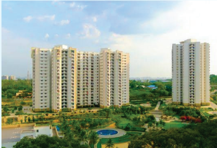
ఈ రంగంపై మరింత విశ్వాసాన్ని పొందడంతో పాటు సాంఘిక ప్రధాన లక్ష్యంగా మారింది. వర్గ రంగమే తొలి ప్రాధాన్యత అంశంగా మారింది. రియల్ ఎస్టేట్ రంగానికి మరింత డిమాండ్ పెంచుతుందని హాజింగ్. కామ్ అధ్యయనం తెలిసింది. దశాబ్దకాలంగా రియల్ ఎస్టేట్ క్రయ విక్రయాలు, సురక్షితమైన పెట్టుబడి అవకాశాల పై చేసిన అధ్యయనంలో ఈ విషయం వెల్లడైంది.

పెట్టుబడి అవకాశాలు ఎన్ని ఉన్నా... ఉత్తమ మైన, సురక్షితమైన అవకాశం మాత్రం ఎప్పటికీ రియల్ ఎస్టేట్ అని మరోసారి వెల్లడైంది. జాతీయ స్థాయిలో నిర్వహించిన అధ్యయనంలో ఎన్ఎడ్, స్టాక్స్, బంగారం కొనుగోళ్ల కంటే ఎక్కువ మంది స్థిరాస్తిని కొనుగోలు చేయడమే ఉత్తమంగా భావించారు. ప్రముఖ రియల్ ఎస్టేట్ అధ్యయన సంస్థ హాజింగ్. కామ్, నరెడ్కో దేశవ్యాప్తంగా నిర్వహించిన అధ్యయనంలో ఎక్కువ మంది రియల్ ఎస్టేట్లో ఆస్తులు కొనుగోలు చేయడానికి ప్రాధాన్యతనిచ్చారు. ఇదే పెట్టుబడికి భరోసా, రెట్టింపు అదాయ మార్గంగా చూసి కొనుగోలు చేసేందుకు ఆసక్తి చూపుతున్నామని పేర్కొన్నారు. మొత్తం 48శాతం మంది రియల్ ఎస్టేట్ రంగానికి తొలి ప్రాధాన్యతనిచ్చారు. ఆ తర్వాత ఎన్ఎడ్ (19%), స్టాక్స్ (18%), బంగారం (15%) వంటి వాటికి ప్రాధాన్యత ఇస్తున్నారని వెల్లడైంది.