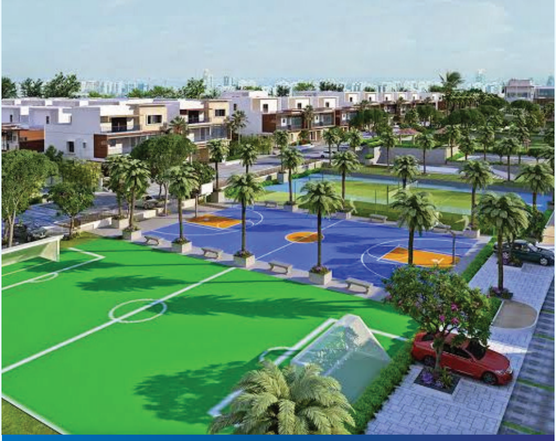
ప్రోత్సాహకాలతో మరిన్ని పెట్టుబడులు మార్కెట్ స్థితిగతులపై ప్రభావితం కాని రియల్ ఎస్టేట్ రంగంలో క్రయవిక్రయాలు, పెట్టుబడులు ప్రోత్సాహకాలతో మరింత పెరుగుతాయని తేలింది. సులభతరమైన చెల్లింపుల విధానం, డెవలపర్లకు ప్రత్యేక ఆఫర్లు, స్టాంప్ డ్యూటీ, జీఎన్టీలో రాసుకుంటున్న వంటి ప్రోత్సాహకాలను కల్పించడం వలన ఆరు నెలల వ్యవధిలోనే స్థిరాస్తి కొనుగోళ్లు మరింత వుంజుకునే అవకాశం ఉంటుందని హాజింగ్ డాట్ కామ్, నరెడ్కో పరిశీలనలో తేలింది. ఈ విధాన జనవరి నుంచి జూన్ వరకు నిర్వహించిన ఫలితాలను విశ్లేషిస్తూ ఈ నివేదికను విడుదల చేసింది.

మార్కెట్ స్థితిగతులపై ప్రభావితం కాని రియల్ ఎస్టేట్ రంగంలో క్రయవిక్రయాలు, పెట్టుబడులు ప్రోత్సాహకాలతో మరింత పెరుగుతాయని తేలింది. సులభతరమైన చెల్లింపుల విధానం, డెవలపర్లకు ప్రత్యేక ఆఫర్లు, స్టాంప్ డ్యూటీ, జీఎన్టీలో రాసుకుంటున్న వంటి ప్రోత్సాహకాలను కల్పించడం వలన ఆరు నెలల వ్యవధిలోనే స్థిరాస్తి కొనుగోళ్లు మరింత వుంజుకునే అవకాశం ఉంటుందని హాజింగ్ డాట్ కామ్, నరెడ్కో పరిశీలనలో తేలింది. ఈ విధాన జనవరి నుంచి జూన్ వరకు నిర్వహించిన ఫలితాలను విశ్లేషిస్తూ ఈ నివేదికను విడుదల చేసింది.