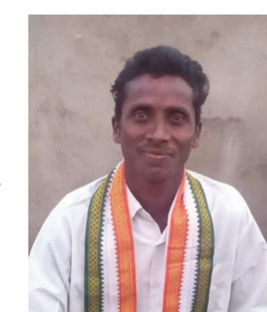
కి తీసుకువచ్చి బహుమతిగా ఇవ్వాలిని బాధ్యత తెలంగాణ రాష్ట్రంలో కాంగ్రెస్ పార్టీని అధికారంలో

మహిళా బాబా దివ్య పాలెం, విశాల భారతి: సోనియా గాంధీ ప్రకటించిన ఆరు గ్యారంటీ స్కీమ్లకు ప్రజల్లో అనూహ్య స్పందన వస్తోందని కాంగ్రెస్ పార్టీ బయ్యారం టౌన్ పునెడెంట్ శ్రీనివాస్ రెడ్డి అన్నారు. గ్రామాల్లో రచ్చబండల వద్ద ప్రజలు చర్చించుకుంటున్నారన్నారు. గ్రామాల్లో పది మంది కూడితే ఇదే చర్చ జరుగుతోందని, పట్టణ ప్రాంతాల్లో టీ స్టాల్లో కూడా ఇదే చర్చ జరుగుతుందన్నారు. 6 గ్యారంటీ కార్డుల గురించి ప్రజల్లో విస్తృత చర్చలను చేసే కర్ణాటకలో మాదిరిగా తెలంగాణలో కాంగ్రెస్ పార్టీని అధికారం లోకి తీసుకు వచ్చేందుకు కృషి చేయాలని పిలుపునిచ్చారు. తెలంగాణ ఇచ్చిన సోనియా గాంధీకి తీసుకు వచ్చి బహుమతిగా ఇవ్వాలిని బాధ్యత తెలంగాణ రాష్ట్రంలో కాంగ్రెస్ పార్టీని అధికారంలో