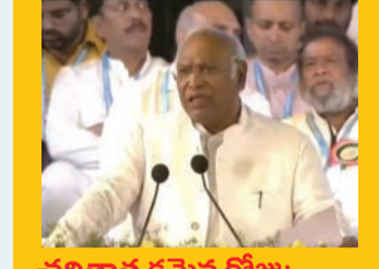
చరిత్రాత్మకమైన రోజు: మల్లికార్జును ఖర్చే

దారులన్నీ విజయభేరి కే.. పల్లె నుంచి పట్టణ దాకా.. దారులన్నీ అలువైసీ.. కారులన్నీ ఆ పైసీ.. రోడ్డు నిండిపోయాయి.. ఎటు చూసినా ఒకటే జనం.. జై సోనియమ్మా, జై కాంగ్రెస్ అంటూ నినాదాలతో హోరెత్తించారు. విజయభేరికి వేదికైన రంగారెడ్డి జిల్లా మహేశ్వరం నియోజకవర్గం తుక్కుగూడ వైపు వెళ్లే దారులన్నీ ట్రాఫిక్ లో కిక్కిరిసిపోతాయి. రాష్ట్ర నలుమూలల నుంచి భారీగా ప్రజలు తరలివచ్చారు. నాయకుల అంచనాలకు మించి జనం చేరుకున్నారు. 10 లక్షల మంది అంచనా వేశామని, అంచనాలకు మించి హాజరయ్యారని నేతలు పార్కం వ్యక్తం చేశారు. దీంతో ప్రతినిధుల సభతో పాటు ప్రాంగణాల్ని కిటికీలాడాయి. హైదరాబాద్ జాతీయ రహదారులు వాహనాల రద్దీలో గంటల కొద్దీ ట్రాఫిక్ జామ్ అయ్యింది.