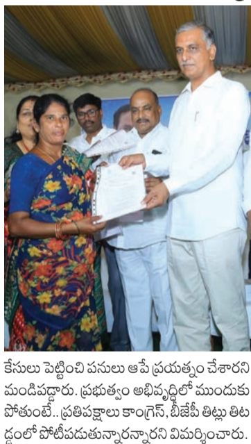
కేసులు పెట్టించి పనులు అపే ప్రయత్నం చేశారని మండిపడ్డారు. ప్రభుత్వం అభివృద్ధిలో ముందుకు పోతుంటే.. ప్రతిపక్షాలు కాంగ్రెస్, బీజేపీ తిట్లు తిల డ్లోనే పోటీపడుతున్నారని విమర్శించారు.

సిద్ధిపేట, విశాలభారతి: పైరవీలకు తావు లేకుండా గృహలక్ష్మి పథకాన్ని అమలు చేస్తున్నామని మంత్రి హరీశ్ రావు పేర్కొన్నారు. సిద్ధిపేట జిల్లాకేంద్రంలోని కొండమల్లయ్య గార్డెన్ లో గృహలక్ష్మి అభివృద్ధి కార్యక్రమం మంజూరు పత్రాలను అందజేశారు. ఈ సందర్భంగా ఆయన మాట్లాడుతూ.. రూ.3లక్షల ఇంటి మహాలక్ష్మి పేరుమీద మహిళలకు అందిస్తే ప్రతి రూపాయి సర్దిబియోగాం అవుతుందన్నారు. అందరికీ ఒకేసారి ఇవ్వడం ఇబ్బందన్న ఆయన ముందువెనుకా అందరికీ ఇస్తామన్నారు. కాంగ్రెస్ ప్రభుత్వ హయాంలో ఎన్నో లంచాల ఇచ్చిన ఇబ్బ దుక్కులేదని గుర్తుచేశారు. మన ప్రభుత్వంలో ఏ మధ్యవర్తులు, పైరవీలు లేకుండా నేరుగా ఖాతాల్లోనే డబ్బులు జమచేయనున్నట్లు పేర్కొన్నారు. రెండు నెలల వరకు చూసి పన్నెండు చెయ్యని వారికి ఇబ్బదులు మరొకరిని ఎంపిక చేస్తామన్నారు. రాష్ట్రంలో కాంగ్రెస్ ప్రాజెక్టులకు అడ్డంపడడం..