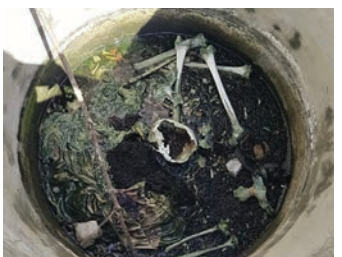
క్షల నిమిత్తం వైద్యులకు సమాచారం ఇవ్వడం జరిగిందన్నారు. అన్ని కోణాల్లో దర్యాప్తు చేస్తున్నట్లు తెలిపారు.

మేడ్చల్, విశాలభారతి: శామీర్యేట్ పోలీస్ స్టేషన్ పరిధిలో గుర్తుతెలియని కుళ్లిపోయిన శవం లభ్యమైన సంఘటన జరిగింది. బాధాపవ్ రిసార్చ్ సమీపంలో కుళ్లిపోయిన మృతదేహాన్ని గుర్తించిన స్థానికులు వెంటనే పోలీసులకు సమాచారం ఇవ్వడంతో సంఘటన స్థలానికి చేరుకొని సీబి నిరంజన్ రెడ్డి అధికారులు శవపంచనామా నిర్వహించారు. మృతి దేహం పూర్తిగా కులిపోయి అస్తిపంజరంగా మారిపోయిందన్నారు మృతదేహం ఆడ మగ ఎంత వయసు తెలియ రాలేదని వైద్యులతో పరి