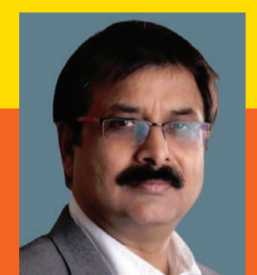
టాక్ ఆఫ్ ద సిటీగా హైదరాబాద్