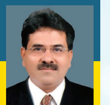
కేటీఆర్ సారథ్యంలో తెలంగాణ

కొత్త రాష్ట్రంగా ఏర్పాటైన అనేక కాలంలోనే ప్రణాళికాబద్ధమైన పాలనలు, ప్రభుత్వ దూరదృష్టి, కేటీఆర్ లాంటి సమర్థులైన మంత్రుల సారథ్యంలో తెలంగాణ దూసుకుపోతుంది. మహారాష్ట్రలోని 24 నగరాల సుపరి ప్రాతినిధ్యం వహిస్తూ ఇక్కడికి 240 మంది ప్రతినిధులు హైదరాబాద్ వచ్చి కోసం ఏకగ్రీవంగా ఎంపిక చేసుకుని ముందుకు వచ్చాం. ఇక్కడ జరుగుతున్న అభివృద్ధి, ఉద్యోగ, ఉపాధి అవకాశాలు నిర్మాణ రంగంలో చోటు చేసుకుంటున్న విప్లవాత్మక మార్పులను అధ్యయనం చేసినందుకు ఆసక్తితో ముందుకు వచ్చాం. ప్రస్తుతం ఐటీ, ఇండస్ట్రీ, ఎకనామిక్స్ శాఖలకు ప్రాతినిధ్యం వహిస్తూ హైదరాబాద్ నగరాన్ని టాక్ ఆఫ్ ద సిటీగా దేశం ముందు నిలబడేలా చేయడం వెనుక ఎంతో మేధోమథనం, మరెంతో దూరదృష్టితో కూడిన ప్రాతినిధ్యం ఉంటుంది. మూడు రోజుల పర్యటనలో భాగంగా హైదరాబాద్ అభివృద్ధి, నిర్మాణ రంగంలో చేపట్టిన ప్రాజెక్టులు, విల్లాల, భారీ భవనాలతోపాటు, హైరైజ్ ప్రాజెక్టులు, సోషల్ ఇన్ ఫ్రా ప్రాజెక్టులను గురించి తెలుసుకునే అవకాశం కల్పించిన క్రెడాయ్ తెలంగాణ, హైదరాబాద్ బృందానికి అభినందనలు. ముఖ్యంగా ఇక్కడ అమలు చేస్తున్న పాలసీలు, నిర్ణయాలను నేరుగా తెలుసుకునే అవకాశం ఈ స్టడీ టూర్ రూపంలో ప్రతినిధులందరికీ దక్కింది.