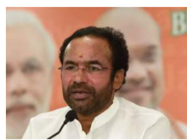
కావడంలో.. ప్రజల సహకారం చాలా కీలకంగా ఉంది తెలిపారు. దీని కారణంగానే.. 21వ శతాబ్దిలోనే అత్యంత ప్రభావవంతమైన, విజయవంతమైన సమావేశాలను దేశం మగతా 2లో

న్యూ ఢిల్లీ, విశాలభారతి: జీ20 సమావేశాల బాధ్యతను, భారతదేశం స్వీకరించినప్పటి నుంచి ప్రధానమంత్రి నరేంద్ర మోదీ పనులైతే కుటుంబకం' న్యూర్ని ప్రపంచమంతా వ్యాప్తం చేసే లక్ష్యంతో పనిచేస్తున్నారని కేంద్ర సహాయ మంత్రి, తెలంగాణ రాష్ట్ర బీజేపీ అధ్యక్షులు కిషన్ రెడ్డి అన్నారు. ఆదివారం మిడియాతో మాట్లాడుతూ భారత్ అనేక రంగాలు, వివిధ మంత్రిత్వ శాఖలకు సంబంధించి దాదాపు 225 సమావేశాలు, 60కి పైగా నగరాల్లో జరిగాయి. వీటిలో దాదాపు 115 దేశాల నుంచి 25వేలకు పైగా మంది ప్రతినిధులు పాల్గొన్నారు. ఈ సమావేశాలు ప్రారంభమైనప్పటినుంచీ ఢిల్లీలో ముగింపు సమావేశాలు విజయవంతం