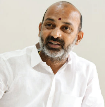
పేర్కొన్నారు. అన్నాచెల్లెల అనురాగానికి విహంగా నిలిచిన రక్షాబంధన ప్రతి ఒక్కరూ జరుపుకోవాలని.. దేశంలోని సోదర భావాన్ని పెంపొందించాలని బండి సంజయ్ కుమార్ కోరారు.

ఈ సందర్భంగా సోదరభావ అనుబంధానికి విహంగా నేను నీకు రక్ష.. నువ్వు నాకు రక్ష.. మన మధ్య.. ధర్మానికి, సమాజానికి, దేశానికి రక్షా అనే ఆలోచనతో జరుపుకునే పండుగ రాఫీ పార్లమెంట్ అని బండి సంజయ్ పేర్కొన్నారు. దేశ, రాష్ట్ర ప్రజలకు రాఫీ పార్లమెంట్ శుభాకాంక్షలు తెలిపారు. పండుగ వాతావరణంలో దేశవ్యాప్తంగా రాఫీ పార్లమెంట్ పుకుంటున్న హిందువులందరూ సంతోషంగా ఉండాలని ఆయన ఆకాంక్షించారు. ప్రతి ఒక్కరూ ప్రతి నిత్యమూ దేశ రక్షణ కోసం, ధర్మం కోసం, సమాజం కోసం, పేదల బాగు కోసం, ముందుకు సాగినప్పుడే రక్షాబంధనను సాధ్యం చేసుకోవాలని బండి సంజయ్ కుమార్ కోరారు.