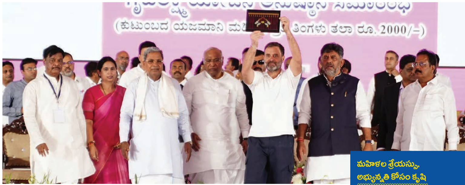
మహిళల శ్రేయస్సు, అభ్యున్నతి కోసం కృషి

ఈ సందర్భంగా హాజరైన అనేక జనవాహిని ఉద్దేశించి రావాల గాంధీ మాట్లాడారు. రాశి పార్లమెంట్ సందర్భంగా తన సోదరి ప్రయోగ గాంధీ ఈరోజు రాశి కట్టించి, ఇదే రోజు తన తేతుల మీదుగా 'గృహలక్ష్మి' పథకం ప్రారంభం కావడం చాలా సంతోషంగా ఉందని చెప్పారు. కేంద్రంలో అధికారంలో ఉన్న ప్రభుత్వం కోటి శ్రమల కోసం పని చేస్తోందని, కర్ణాటకలోని తమ ప్రభుత్వం మాత్రం పేదలు, బలహీనుల వర్గాలు, మహిళల శ్రేయస్సు, వారి అభ్యున్నతి కోసం కృషి చేస్తోందని వ్యాఖ్యానించారు.