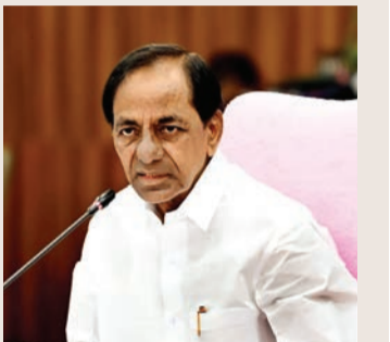
సీఎం కేసీఆర్ నిర్ణయం తీసుకున్నారు. ఈ సందర్భంగా రాజేశ్వర్ రావు

-సీఎం కేసీఆర్ నిర్ణయం హైదరాబాద్, విశాలభారతి: ప్రముఖ స్వాతంత్ర్య సమర యోధుడు, తెలంగాణ సీనియర్ రాజకీయవేత్త, దివంగత చెన్నమనేని రాజేశ్వర్ రావు శత జయంతి సందర్భంగా ముఖ్యమంత్రి కేసీఆర్ కీలక నిర్ణయం తీసుకున్నారు. ఆయన చేసిన సామాజిక సేవను గుర్తిస్తూ.. సి రిస్కల్ వేములవాడ నియోజకవర్గాల పరిధిలో సాగు, తాగునీరు అందిస్తున్న కాళేశ్వరం ప్రాజెక్టులోని ప్యాకేజీ 9 (మల్కపేట రిజర్వాయర్ తో పాటు దాని పరిధిలోని కాల్వలకు మిడ్ మానీర్ నుంచి అప్పర్ మానీర్ దాకా) కు చెన్నమనేని రాజేశ్వర్ రావు పేరు పెడుతూ