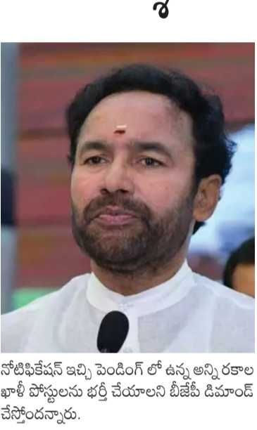
నోటిఫికేషన్ ఇచ్చి పెండింగ్ లో ఉన్న అన్ని రకాల ఖాళీ పోస్టులను భర్తీ చేయాలని బీజేపీ డిమాండ్ చేస్తోందన్నారు.

నిరుద్యోగులపై దాడి నియంత పాలనకు నిదర్శనం. అసెంబ్లీ సాక్షిగా సీఎం కేసీఆర్ ఇచ్చిన హామీ ప్రకారం 13వేల టీచర్ పోస్టులు భర్తీ చేయాలని అడిగితే పోలీసులతో దాడి చేయారా? అని ప్రశ్నించారు. అధికార పార్టీకి కొమ్ముగా... నిరసన చేపట్టిన అభ్యర్థులను 'కొట్టండి, ఈడ్యుండి' అంటూ పోలీసులకు ఆదేశాలుచ్చడం, దాడికి పురిగొల్పడాన్ని, మీడియా ప్రతినిధులపై కూడా దాడికి పాల్పడతూ ప్రభుత్వం ప్రోత్సహించడాన్ని బీజేపీ తీవ్రంగా ఖండిస్తోందన్నారు. తెలంగాణ రాష్ట్రంలో ఎవరైనా లాంటి బీకటి రోజులు ఉన్నాయనడానికి కేసీఆర్ నియంత పాలన అనదానికి జరుగుతున్న ఘటనలే సాక్ష్యాలు అని కిషన్ రెడ్డి అన్నారు. ఇటీవల గ్రూప్ 2 పరీక్షల నిర్వహణ వాయిదా వేయాలని కోరుతూ నిరుద్యోగులు దర్శన చేసే మహిళలకు కూడా చూడకుండా పోలీసులు లాఠీచార్జ్ చేసి అక్రమంగా అరెస్టు చేశారు.. కేసీఆర్