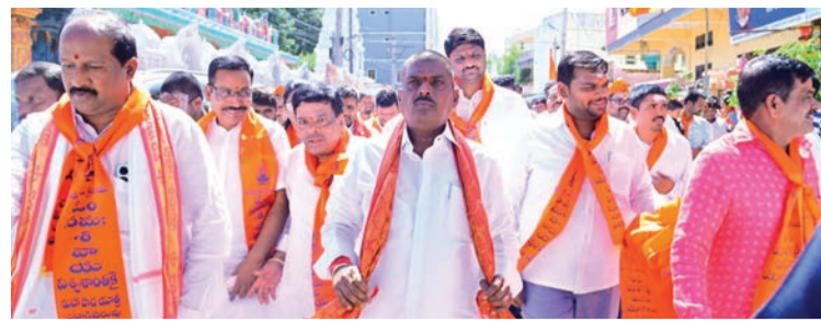
విశ్వశాంతి కోసం వీరశైవ లింగాయత్ సమాజం పాదయాత్ర