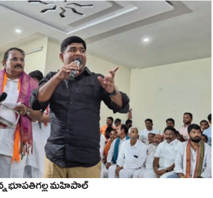
ప్రసంగిస్థుడు, భూపతిగల్ల మహిపాల్