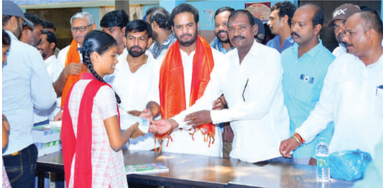
పేద విద్యార్థులకు సహాయం అందించడమే లక్ష్యం