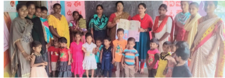
పుట్టిన బిడ్డకు తల్లిపాలు అమ్మతం