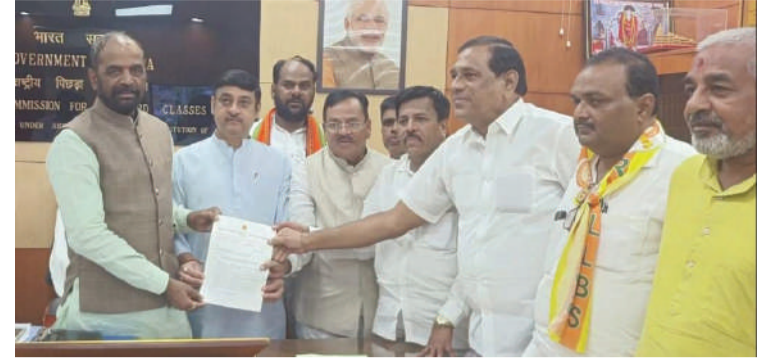
జాతీయ బీసీ కమిషన్ కలిసిన లింగాయత్ ప్రతినిధులు