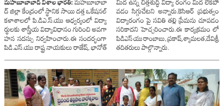
పుట్టిన బిడ్డకు తల్లి పాలు అమ్మతం లాంటివి