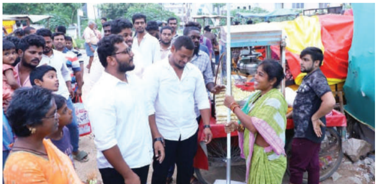
రఘునాథ్ ఫౌండేషన్ ఆధ్వర్యంలో చిరు వ్యాపారులకు గొడుగుల పంపిణీ