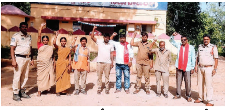
అక్రమ అరెస్టులతో ఉద్యమాన్ని ఆపలేరు