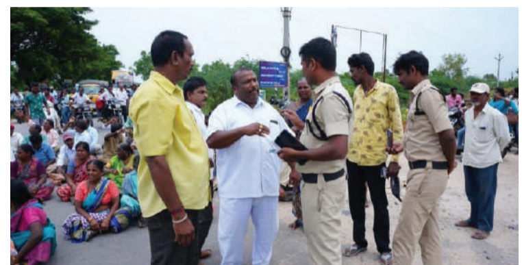
గ్రామపంచాయతీ కార్యకుల ముందస్తు అరెస్టు