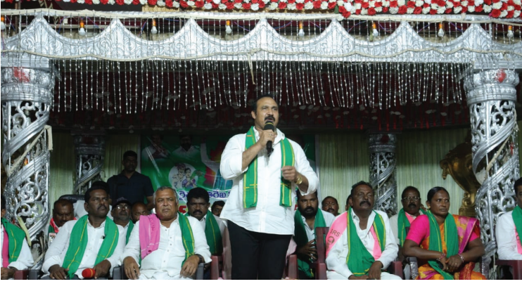
గత పాలకులు చేయలేని అభివృద్ధి బిఆర్ఎస్ ప్రభుత్వం చేసింది