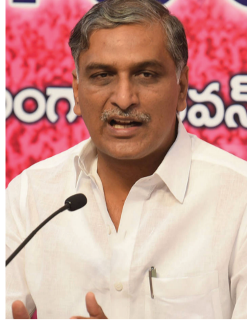
నికీ పగటిపూట రెండు గంటల కరోటీ కూడా లేదని అప్పట్లో ఈ నేతలే ధర్నాలు చేసిన విషయం మరిచిపోయారు. కాంగ్రెస్ అధికారంలోకి వస్తే.. నాటి ప్రముఖ పత్రికలు రాశాయి. రైతులకు ఏడు గంటల కరోటీ కూడా ఇప్పలేమని నాటి ముఖ్యమంత్రి స్టేట్ మెంట్లు ఇచ్చిన విషయాన్ని కాంగ్రెస్ నేతలు మరిచిపోయారు. వ్యవసాయ